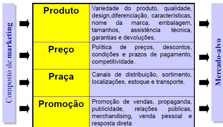
Figura 1 - Composto de Marketing Mix (4P’s)